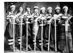
Équipe de hockey des filles 1900

HerstoriesCafé , qui a obtenu du financement THEN/HiER au cours des deux dernières années, a reçu un prix communautaire de Heritage Toronto en reconnaissance de son approche contemporaine et novatrice de la programmation historique locale. Le jury a aussi noté le fait que le groupe présente une grande diversité de perspectives sur l'histoire locale et mets en contexte des récits jusqu'ici inconnus.