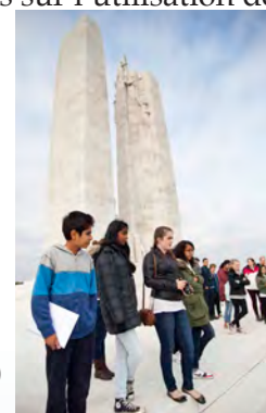
Les étudiants au Monument commémoratif du Canada à Vimy (Stuart Foster)