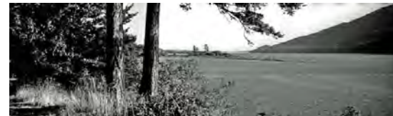
Portage Island, Lummi Reservation