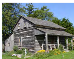
Reconstruction de la propriété familiale Donnelly à Lucan, Ontario (Jennifer Pettit)