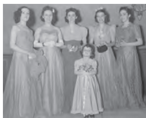
Parade d'Éléances, Conrad Poirier. Domaine public, via Wikimedia Commons