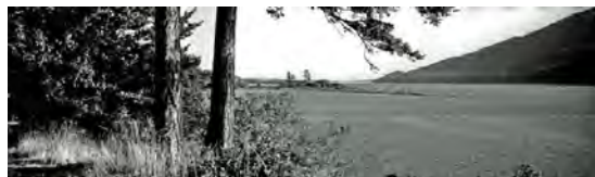
Portage Island, Lummi Reservation.

Mon travail en histoire de l'éducation se dessine comme un voyage en canot dans le temps et l'espace des Salish de la côte. Dans les cosmologies salish, il importe de visiter régulièrement les sites d'où émanent les grands récits porteurs de sens culturels et mythiques. Les voyageurs se rendant aux sites anciens afin d'y redécouvrir un passé animé par les rochers, les montagnes, les glaciers et les autres références importantes de leur monde visitaient également les villages où ils participaient à des cérémonies qui fournissaient des références anciennes aux changements apportés au paysage et aux ressources, comme les sites de pêche et de cueillette. J'ai voyagé partout dans la région sans limites frontalières des Salish de la côte. J'y ai écouté ce que les Autochtones avaient à dire sur l'éducation – au sens large – tout en essayant d'analyser le discours de la société colonisatrice et ses interprétations de l'histoire de la colonisation des peuples autochtones. J'ai porté une grande attention à la réalité des pensionnats et aux conditions dans les établissements d'enseignement supérieur, mais j'ai aussi ressenti le besoin d'écrire sur les méthodologies de recherche afin de trouver un sens au passé dans une perspective transculturelle.