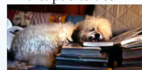
Le chien de Michael.