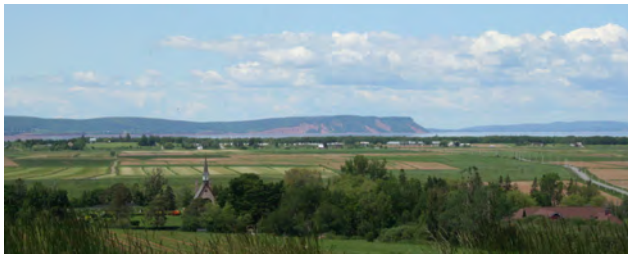
Lieu historique national du Canada de Grand-Pré et site du patrimoine mondial

Au cours des années passées à Parcs Canada, j'ai mené activement des recherches, publiant et présentant des communications sur l'architecture canadienne, la gestion du patrimoine et le patrimoine mondial. Mes recherches universitaires, quant à elles, se sont tournées vers des études interdisciplinaires, lesquelles ont mené, par exemple, à une publication sur le patrimoine paysager et architectural du Campus de la montagne de l'Université de Montréal.