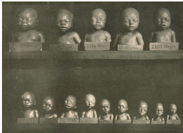
Exemple du racisme du mouvement eugéniste. Image #563, 1921.

Comme j'avais acquis de l'expérience dans l'édition scolaire et dans les ressources pédagogiques numériques et multimédias, je cherchais pour mon doctorat un thème qui combinerait en quelque sorte l'ensemble de ces intérêts et expériences. La réponse me sautait aux yeux : le thème de « l'impact des théories raciales du 19 e siècle menant au génocide » fait partie des manuels de 11 e année. J'ai donc décidé d'analyser ce thème dans les dix titres officiellement approuvés (en Afrique du Sud, les écoles publiques doivent choisir leurs manuels à partir d'une liste). J'avais aussi