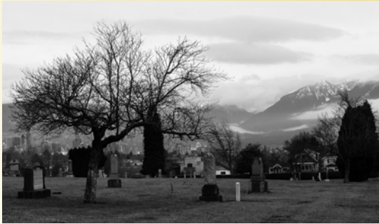
Cimetière Mountain View, Vancouver

C'est avec plaisir que nous vous présentons la cinquième édition de la Revue annuelle publiée par The History Education Network/Histoire et éducation en réseau (THEN/HiER) qui souligne nos principales réalisations, nos projets et les nouvelles les plus importantes de la dernière année.