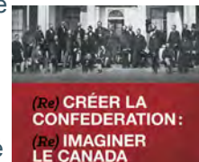
(Re) CRÉER LA CONFÉDÉRATION : (Re) IMAGINER LE CANADA