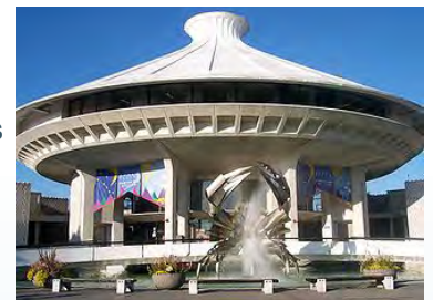
Museum of Vancouver

L'Institut d'été, conçu pour les professeurs, les étudiants aux cycles supérieurs, les concepteurs de programmes, les dirigeants de perfectionnement professionnel et les éducateurs du musée, vise à améliorer leur expertise dans la conception et l'enseignement des cours et des programmes d'histoire en portant une attention explicite à la pensée historique. Les participants ont exploré les six concepts de la pensée historique dans le cadre de deux thèmes de fond : les relations entre les Autochtones et les colons ainsi que les relations entre l'humain et la nature au fil des ans.