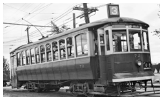
rpaterso d'Oak Bay, Canada (BCER 72 (Vancouver)) [CC-BY-SA-2.0 ( http://creativecommons.org/licenses/by-sa/2.0/ ), via Wikimedia Commons]

Des présentations et des discussions sur l'histoire de Main Street et sur l'importance du district de Brewery Creek étaient au menu de cet événement. Au programme, des allocutions d'Elizabeth Walker, auteure de Street Names of Vancouver , et de Bruce MacDonald, auteur de Vancouver: A Visual History . L'événement avait lieu au Cascade Room au cœur du quartier Mount Pleasant.