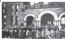
Queen's Park c1917

Au cours de cette soirée où on traitait des récits de la Première Guerre mondiale à l'échelle locale, les participants ont étudié des sources primaires et exploré la base de données des archives de Toronto, puis ont consulté d'autres sources à la maison historique du Musée Spadina. Les pédagogues de l'histoire ont donc eu l'occasion d'utiliser des compétences en pensée historique pour comprendre les impacts de cette guerre sur la population de Toronto.