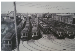
St. Clair Car House 1924 Archives de la Ville de Toronto Série 71s0071_i03256

Cet événement à la Zion Schoolhouse au nord de Toronto fut pour les éducateurs en histoire une occasion d'explorer le passé en passant par le théâtre historique. Une discussion a suivi les performances de trois troupes de théâtre locales. La Single Thread Theatre Company, un organisme local sans but lucratif, présentait la reconstitution d'une journée type dans la classe d'une école du 19 e siècle. Les artistes de Native Earth, un autre organisme sans but lucratif, ont lu des récits saisissants relatant des expériences d'enfants autochtones.